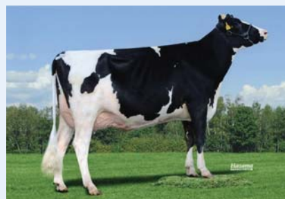
アールチエ ピュアソウル ダイチ 広尾町/目黒 富夫氏 所有 母の父/クレーク BWM ダンティ ET