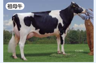
エンドリッチ タイタニック レオ ボルトン