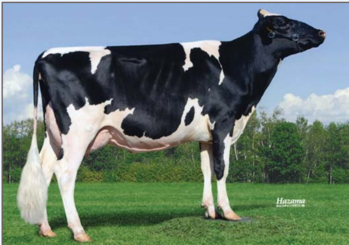
Flair-Ritschul Leo Rows 中標津町/福岡 寿頭 氏 所有 母の父/イングランドアモン ミリオン ET