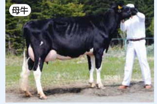
オムラS ブラック サンダー ET