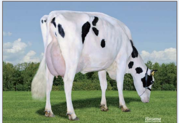
リ グレース モンハン ランドハート (2産目)