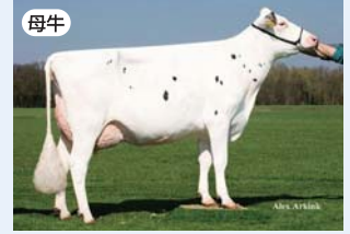
ブロークス ベティ ET