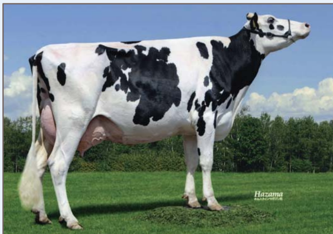
オースター アールチエ ハナ(2産目) 北見市/株式会社 織田ファーム 所有 母の父/G グランチエスター プリウス ET