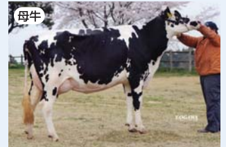
グランディール スーパーステーション スウィート ET