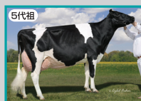
ライルヘイブンリラ セット