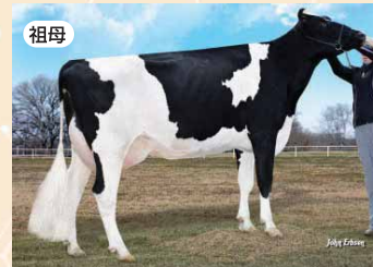
モーニングビュー スーパー ロクシー