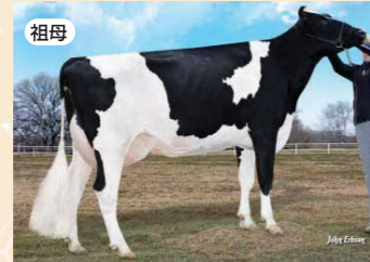
モーニングビュー スーパー ロクシー